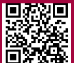
パートナーシップ構築宣言