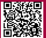
事業継続力強化計画